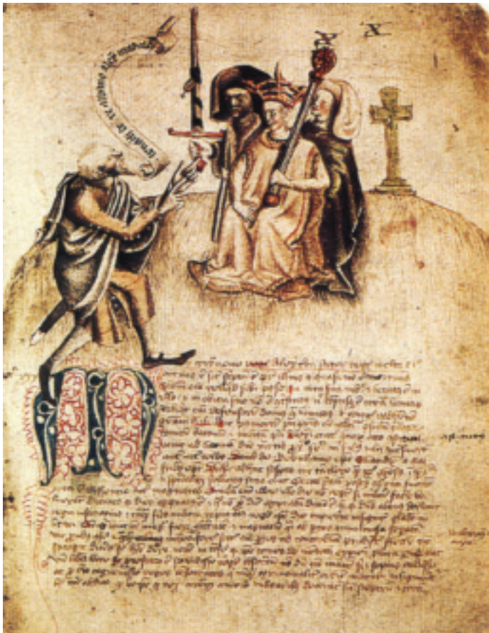
CADWCOF – Cyfarwydd o'r Alban yn adrodd ach Alexander III

Y mae ei lygaid treiddgar ar fy wyneb, y mae ei aelodau'n crynu, fel, wedi ymgolli yn ei chwedl, ac wedi anghofio popeth arall, y mae'n rhoi ei enaid yn y dweud. Yn amlwg wedi ei gyffroi gan y stori, y mae'n gwneud cryn dipyn o ystumiau, a thrwy symud ei gorff, dwylo, a'i ben y mae'n ceisio cyfleu casineb a llid, ofn a digrifwch, fel actor mewn drama. Cwyd ei lais mewn rhai rhannau, dro arall y mae bron iawn yn sibrwd. Y mae'n siarad yn weddol gyflym, ond y mae ei ynganu drwy'r adeg yn eglur. Dwyf fi ddim wedi cyfarfod neb a adroddai ei chwedlau gyda'r fath gelfyddyd ac effaith na'r hen chwedleuwr rhagorol hwn.